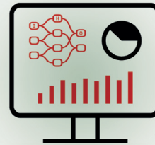
TÜV AUSTRIA Bericht erhalten